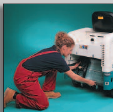
Filter wisselen zonder gereedschap