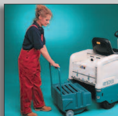
Vuilvergaarbak eenvoudig uitneembaar