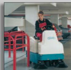
Machine in actie